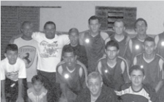
Time de Cordislândia e comissão técnica.