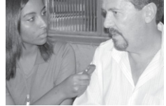
Momento da entrevista.

Nesta entrevista procuramos esclarecer pontos e dados importantes para que este programa possa ser divulgado e melhor compreendido, colaborando para sua implantação nos municípios mineiros.